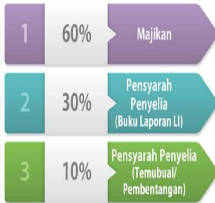
Kriteria Penilaian Latihan

*Sekiranya pelajar DIBERHENTIKAN oleh Majikan, pelajar tersebut akan dikira sebagai GAGAL dalam LI dan keputusan tidak boleh dipinda oleh JPLIKK.